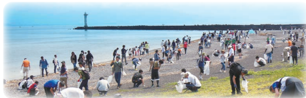
令和1年6月1日 三保真崎海岸清掃活動