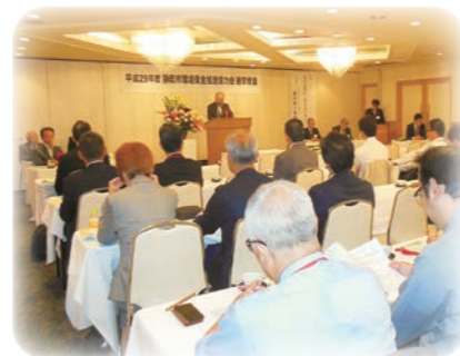
平成29年5月12日 通常総会