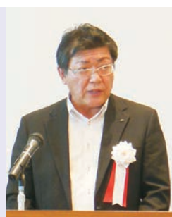
株式会社ノダ 清水事業所 所長

日本においても注目が集まり、政府だけでなく、企業や教育機関等において積極的に取り組まれる様子が各所で見られます。静岡市でも様々な取り組みが評価され、2018年に国から「SDGs未来都市」に選定されており、世界が取り組むべき課題解決の