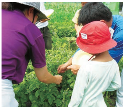
ピザ作りと野菜の収穫体験