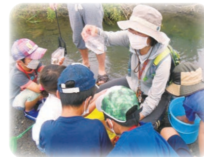
令和4年8月25日 葦科川の生きもの観察会