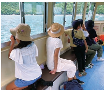
井川湖渡船の乗船体験