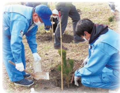
平成27年2月7日 設立10周年記念植樹